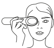
Движение при холодном и горячем массаже